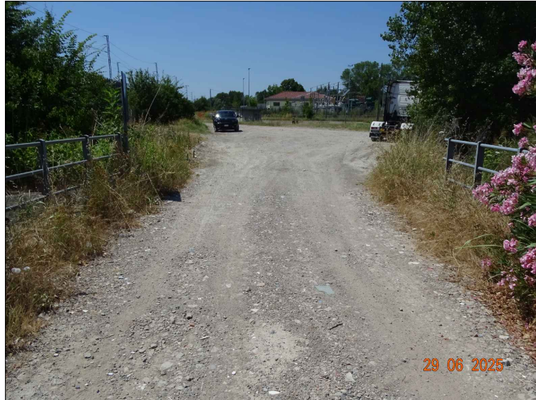
Strada sterrata in prossimità dello scolo n. 1

COMUNE DI SORAGNA (PR) - Strada Vicinale Rivalazzo - FG 46 MAPPALE 7 proprietà