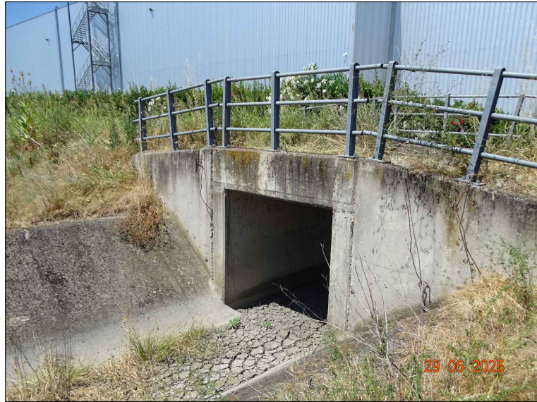
Strada sterrata in prossimità dello scolo n. 2