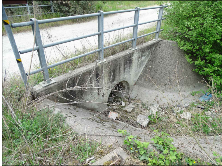
Interferenza scolo n. 1